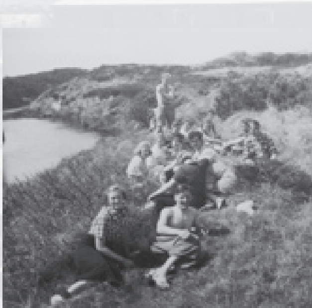
Vandrehjemmet på fælles vandretur langs Henne Mølleå.

Næste morgen kunne hun arrangere fælles vandreture, f.eks. til Blåbjerg eller langs Hennemølleå, hvor man under muntre sange gik rask til havet.