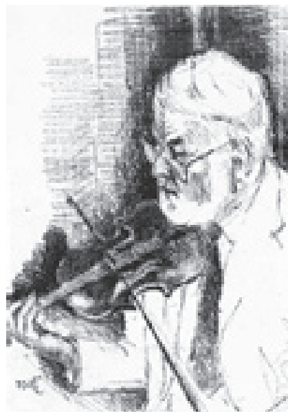
Selvportræt af en spillemand

Efter en ufrivillig pause i krigens sidste år genoptoges Henneferien. Familien byggede nu selv Lunhøj, der i slutnin-