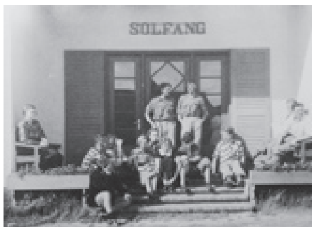
Vandrere samledes ofte på trappen foran "Solfang".