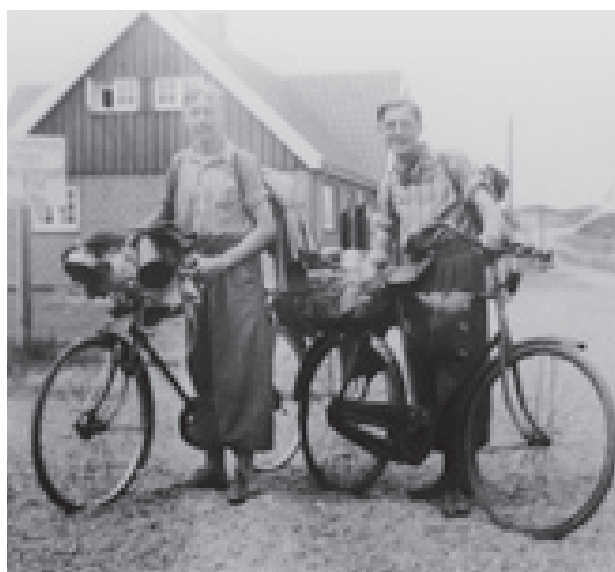
To "vandrere" med cykler og hele oppakningen på vej til nye oplevelser langs de danske landeveje.