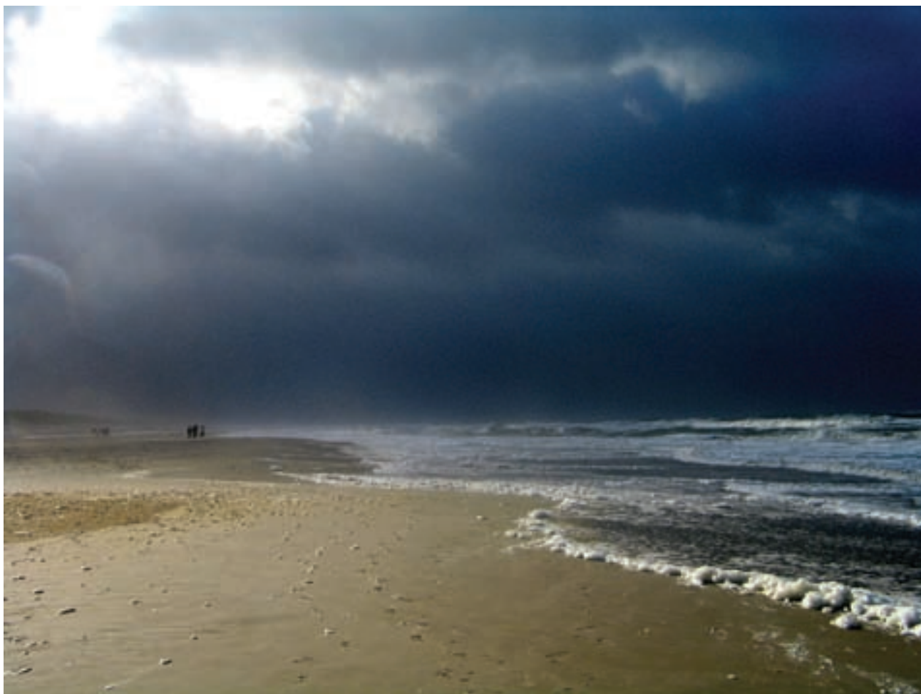
Også med optræk til uvejr præsenterer Henne Strand sig fantastisk året rundt.

Varde kommune har lovet at fjerne trappen til radiotelefonen, således at trafikken den vej op over klitten og nedslidning af beplantningen mindskes.