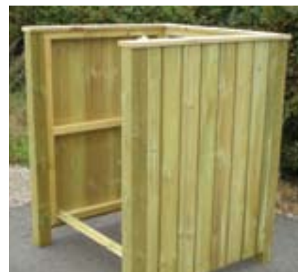
Her ses den nydelige prototype af Blåbjerg Huses tilbud. Hjørnestolperne er her forkortet p.g.a. asfaltunderlaget.

tømninger for de resterende huse, der primært bebos i sommerhalvåret og i de korte ferier: Nytår, vinterferie, påskeferie, bededag, Kr. himmelfart, pinse og efterårsferie og jul. Der forudsættes ugentlige tømninger i juli og august. Bemærk: I 2010 vil de hidtidige 14-dages tømninger foregå i lige uger p.g.a., at indeværende år har 53 uger.