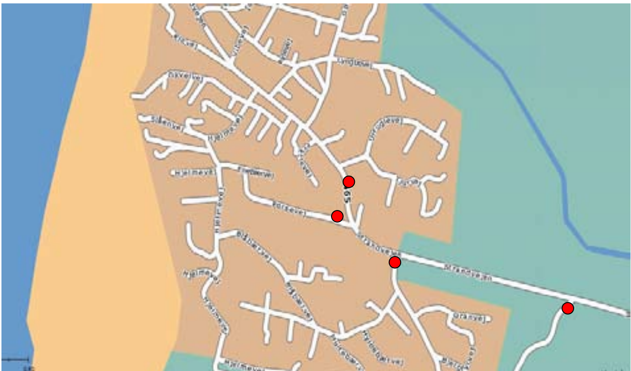
Rød cirkel er placering af hastighedsskilte