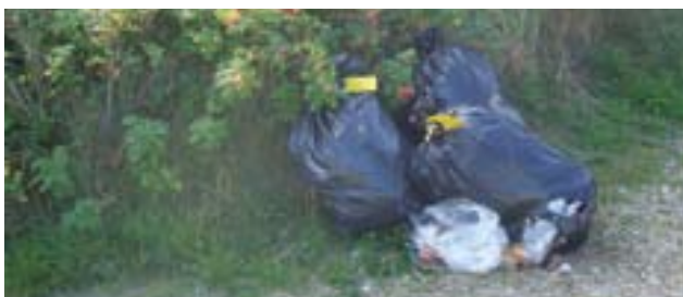
Lejerne har fulgt reglerne, men ejer kunne sikkert have ønsket sig en 240-liters-container.

Containeren bestilles ved henvendelse til Varde Forsyningsselskab, telefon 79946565. På længere sigt udfases også miljøstativet, som, mange vil synes, fungerer godt, men meget ofte rummer for lidt. Også skarnbasseordningen, som kun glæder rævene, men gør naboerne sure, bortfalder. Bestyrelsen bliver inddraget i beslutningerne om den endelige ordning, der muligvis kædes sammen med kommunens nye affaldsregulativ, der skal foreligge inden den 1. Juli 2010