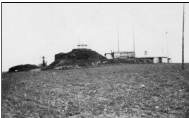
Luftmeldepost, ukendt lokalitet.

Luftmeldeposterne havde normalt en besætning på omkring 10 mand og var bemandede hele døgnet.