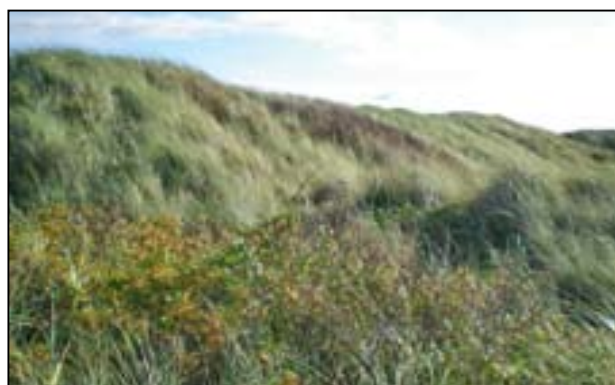
Tankspærring ved sti nr. 69

Fjord samt mellem Ho Bugt og Oksby gjorde man i vid udstrækning brug af det panserhindrende terræn der dengang var i området. Pansergraven tog udgangspunkt ca. 12 km bag Vestkysten, ved Broeng, syd for Oksbøl, op gennem den vestlige del af Oksbøl Lejren, ind over Helle Sø, gennem Vrøgum Klitplantage (her er graven stadig intakt), hvorefter den løb ud i Filsø. Her skal man huske på, at Filsø på dette tidspunkt endnu ikke var så afvandet, som det er tilfældet i dag.