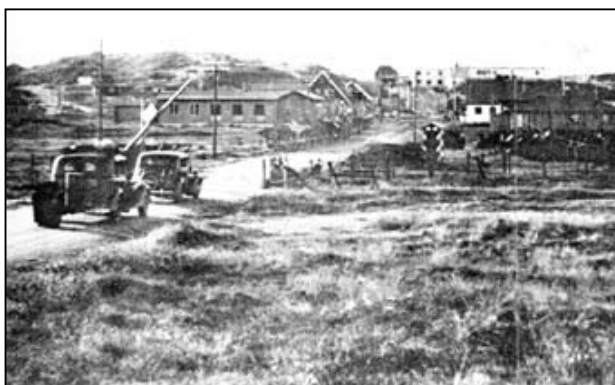
Strandvejen, mod vest, bemærk skilderhuset og længere fremme i vejens venstre side, en række tipvogne. Datering ukendt, sandsynligvis efter 5. maj 1945.

Personellet var underbragt, dels i barakker dels i eksproprierede sommerhuse. Der lå bl.a. en stor trefløjet baraklejr hvor Henne Strand Camping ligger i dag, ellers lå der mange mindre barakker spredt over hele området.