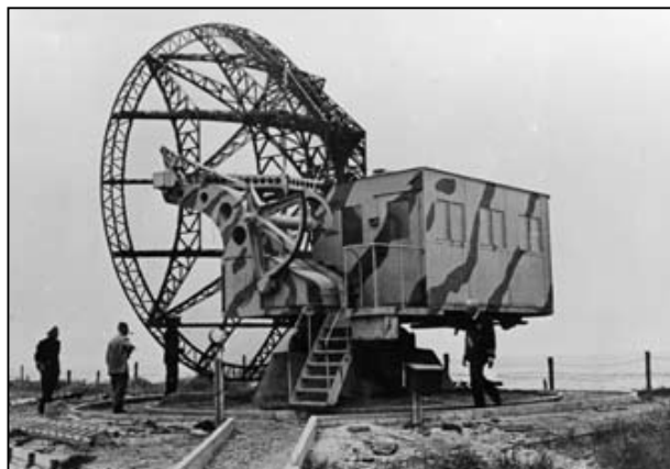
Würzburg Riese radar tilsvarende den, der var opstillet ved Kærgård Strand.

Til betjening af udstyret var der normalt en gruppe på 8-10 mand, der var underbragt i en lille barak lige bag radaren. I nogle tilfælde var der opført en lille betonbunker.