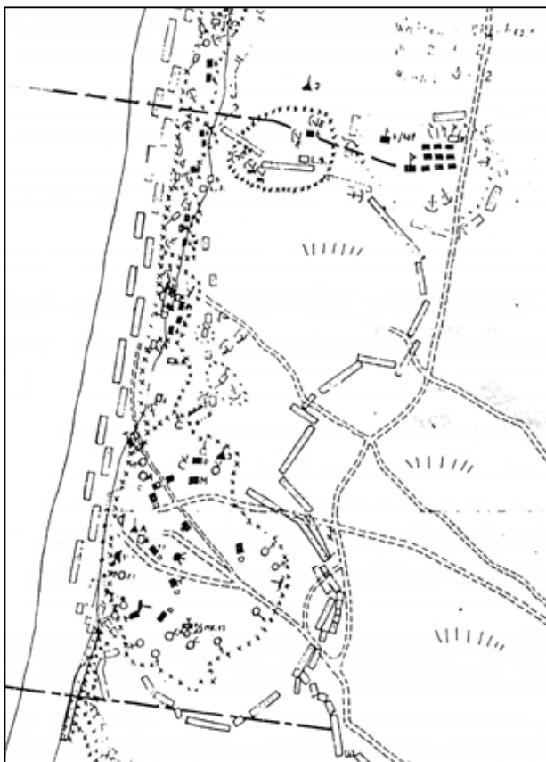
Udsnit af tysk stillingskort fra 1944.

Bunkerne ses opført i perioden november 1943 til hen på foråret 1944.