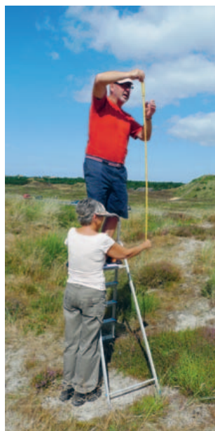
Højden på Madbjerg afsættes med fare for liv og lemmer. Det er sådan vi ser medlemmernes entusiasme.

En gruppe af foreningens medlemmer har i dette år arbejdet for en restaurering af Madbjerg syd for Tuttesbjerg. Gruppen har i den forbindelse ansøgt om midler fra grundejerforeningen, der dog på grund af uafklarede spørgsmål vedr. driften og forholdet til de private grundejere indtil videre ikke har imødekommet gruppens ønsker.