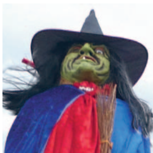
Blochsbjerg kaldte på en dejlig sommeraften.