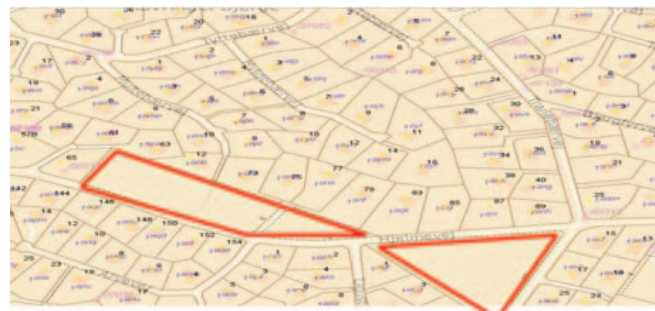
Hederensningsarealer ved Hjelmevej.