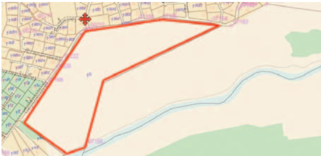
Hederensningsareal mellem Gøjbjergvej og Mølleåen. Krydset viser mødested.