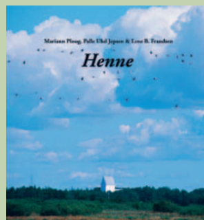
Den nye Hennebog.

Så vidt vides, er Varde Museum stadig interesseret i sponsorer, men det skal gå hurtigt nu.