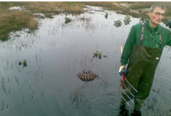
Varde Forsynings check af afløbsforhold for vand ved kuppelrist på den rørlagte strækning over Lyngbos hede

OBS. Referatet fra generalforsamlingen vil - så snart det er udfærdiget og godkendt af dirigenten - kunne læses på www.ghs-henne.dk .