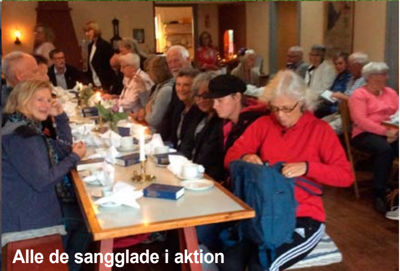
Alle de sangglade i aktion