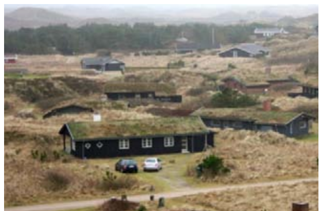
Henne Strand ca. 2013