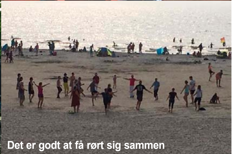
Det er godt at få rørt sig sammen