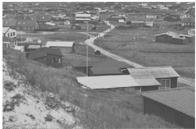
Henne Strand ca. 1940