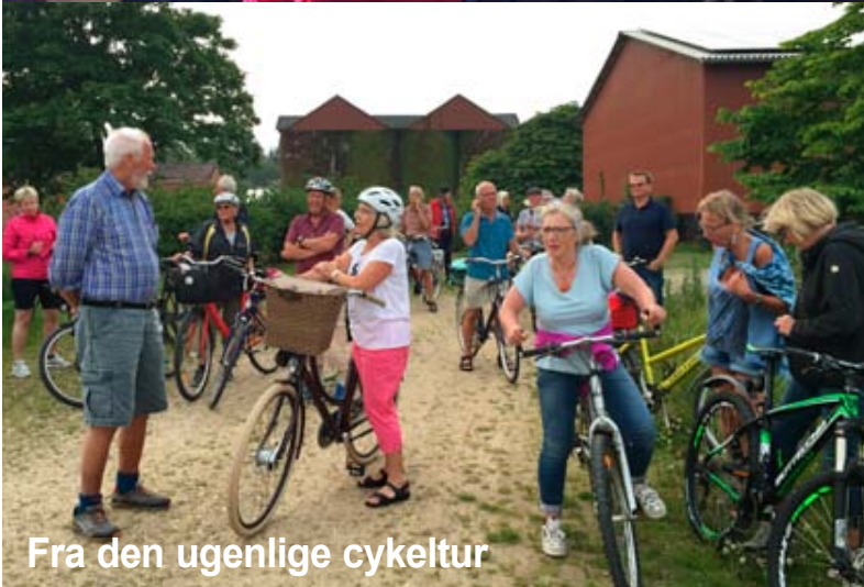
Fra den ugenlige cykeltur