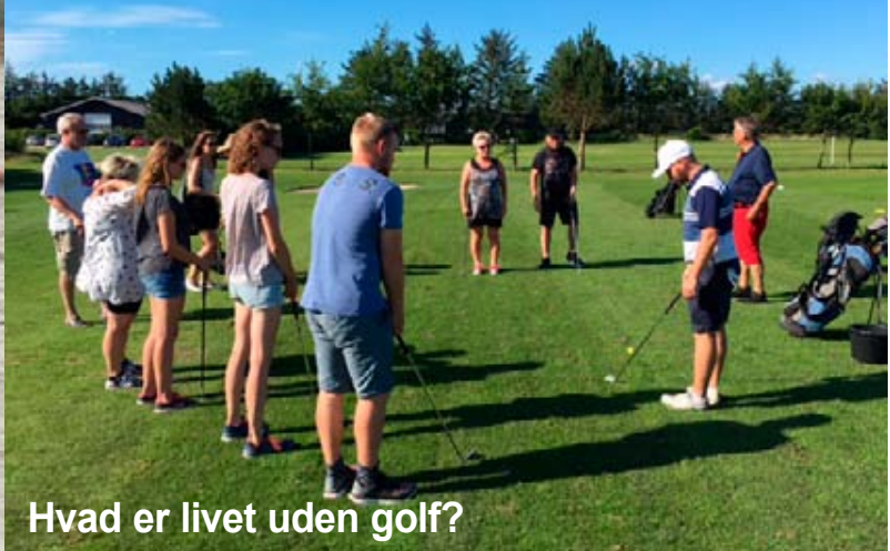
Hvad er livet uden golf?