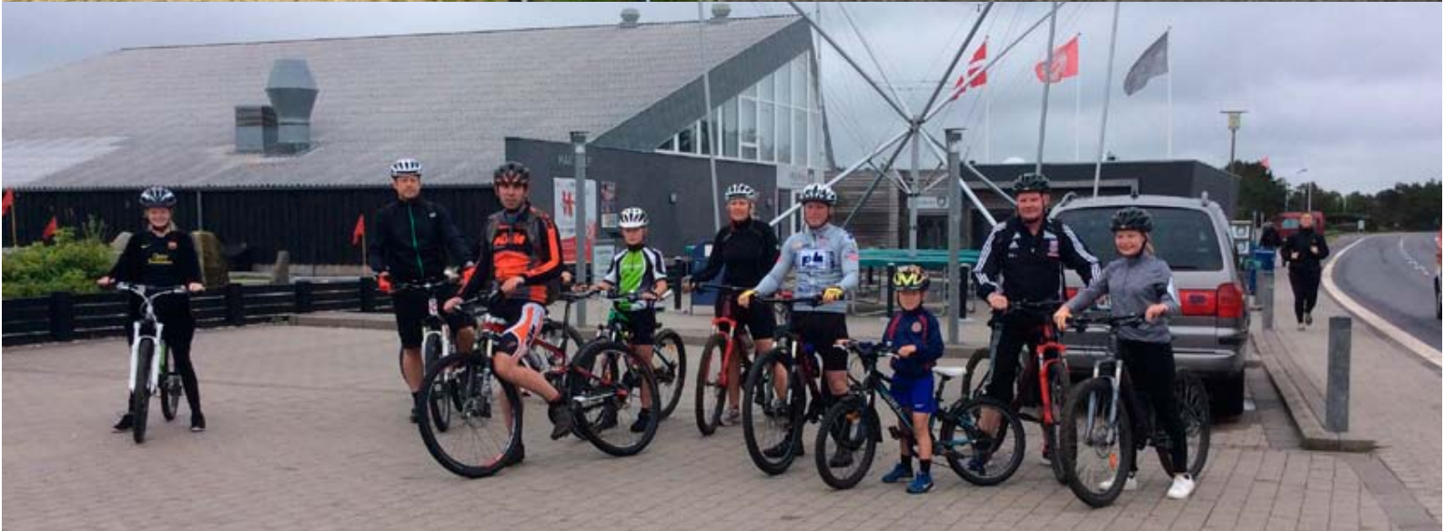
Der var gang i de lejede mountainbikes