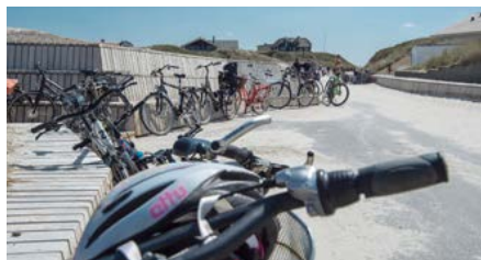
Det var jo ikke meningen.

Fik jeg sagt, at trods et par mangler, så er det afsluttede projekt særdeles tilfredsstillende.