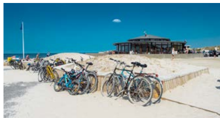
Henne Strand har fået nogle flotte cykelstativer!

Der er også problemer med beplantningen ved torvet. To meter høje almindelig røn er næppe løsningen for træet tørrer let ud og visner i vestsiden. Den bliver derfor helt skæv efter få år i Hennes klima. Start med små planter, og lad dem selv vokse sig store. Plant havtorn, eg, ene, krybende pil og andre af