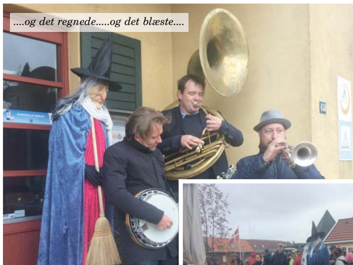
....og det regnede....og det blæste....