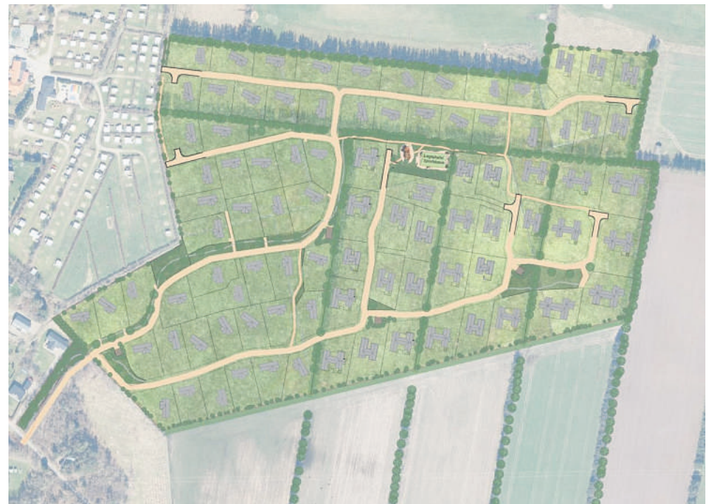
Her ses oplægget til udstykningsplanen for det nye sommerhusområde ved Henneby. Kort: Varde Kommune