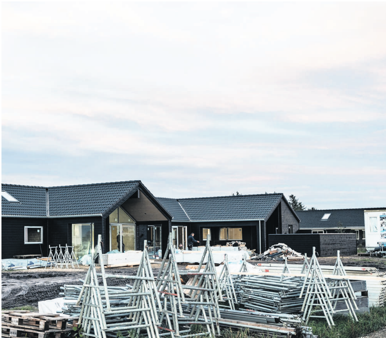
Skanlux er lige nu i gang med at bygge store sommerhuse ved Houstrup Strand, som nu også bliver muligt ved Henneby.

Skanlux har skåret ned i antallet af sommerhuse fra 96 til 91 og samtidig øget de grønne arealer med 5.800 kvadratmeter. Og så går udvalget på kompromis med en næsten ufravigelig regel, at en sommerhusgrund som minimum skal være på 1.500 kvadratmeter i Varde Kommune. Nu hedder det 1.500 kva-