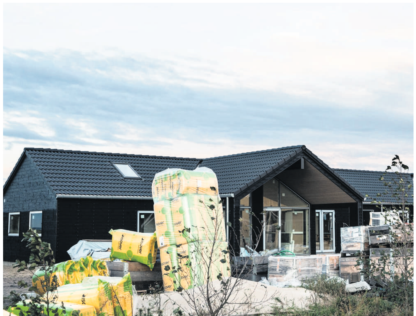
Det er typer som dette sommerhus, der nu bliver muligt at opføre ved Henneby. Dog skal lokalplanen først laves og godkendes. Sommerhuset her opføres på Solvang i Houstrup Strand.

- Man kan mene, hvad man vil om store sommerhuse. Men det vil være med at levere et grundlag for de lokale forretningsdrivende uden for højsæsonen. De store sommerhuse vil medvirke til