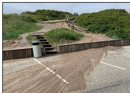
Nedskyllet sand/grus fjernes på Klitvej

På P-pladsen syd for Henne Målleå er udslidt bænk erstattet af ny udført i egetræ. I samme ombæring er der på stranden nedenfor den sydligste sti fra Hjelmevej opstillet egetræsbænk fastgjort på en stor kraftig betonflise, som forhåbentlig muliggør, at bænken kan løftes fri med traktorskovl, når vind og vand flytter rundt på sandet. Bliver erfaringerne hermed gode, vil tilsvarende bænke blive opstillet nedenfor flere af de øvrige stier til stranden.