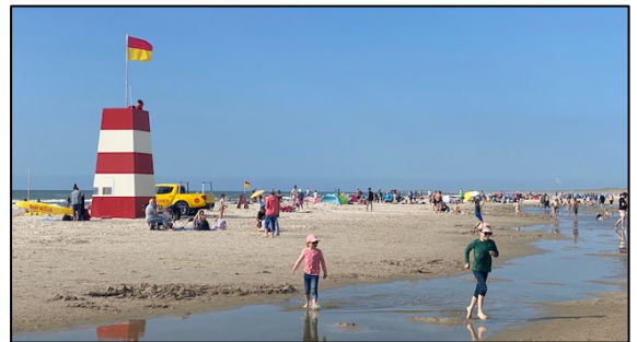
Livredderne har i år assisteret flere nødstedte badegæster

I den forbindelse har der op langs Vestkysten været tre tragiske drukneulykker, og ved Henne Strand har TRYG-fondens livreddere hjulpet adskillige nødstedte badende i land. Der er således al mulig grund til at advare mod de farlige "hestehuller", som i de fleste tilfælde er årsagen til, at badegæster kommer i fare.